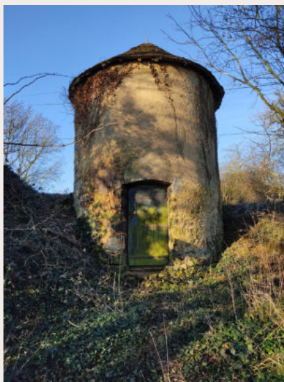
Four à chaux du Vieux-Lavardin

Certains, par bonheur, ont fait l'objet de restaurations et vont pouvoir continuer à nous interroger lors de nos périples sur les chemins : "A quoi peuvent bien servir ces curieuses petites constructions ?".