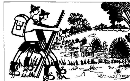
Chemins en Yvré