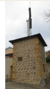
La tour de Ste Foy aujourd'hui