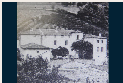
Le château de Charfetaïn