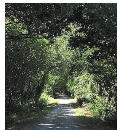
La voie verte, en fin de circuit, fait partie intégrante du Val de la Foucaudière.