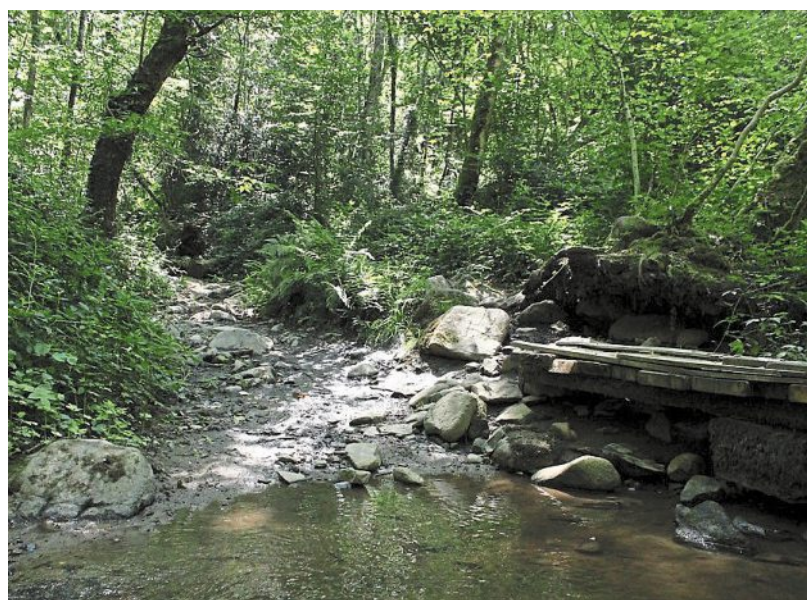
Sur le circuit de Saint-Loup-du-Gast, il faudra traverser le bucolique ruisseau de la Foucaudière.

Renseignements et commande de topo-guides sur mayenne.ffrandonnee.fr