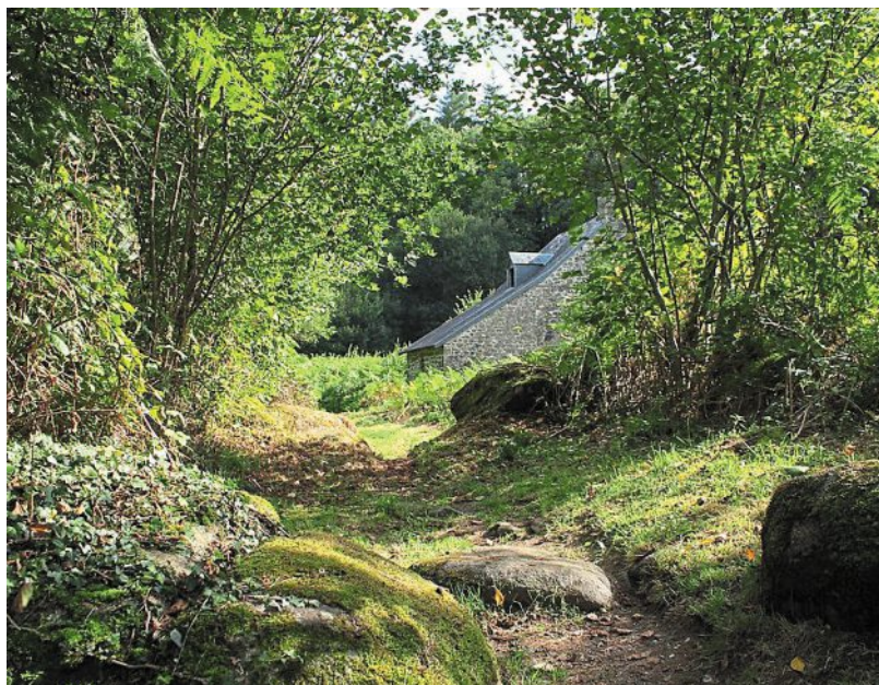
Sur le circuit du Saut-au-loup, les chemins humides mènent à des bâtisses isolées, souvent très bien rénovées.

Il existe plusieurs itinéraires pour boucler le circuit du Saut-au-loup, à Brecé, à user selon le temps et les envies de chacun. Ainsi, le Comité mayennais de la randonnée pédestre propose, dans deux de ses ouvrages, une version de 4,5 km (1 h 30 de randonnée) et une autre de 18,5 km (environ 4 h 45). Celle que nous vous avons présentée, dans cette page, est une autre version bis de 5,5 km.