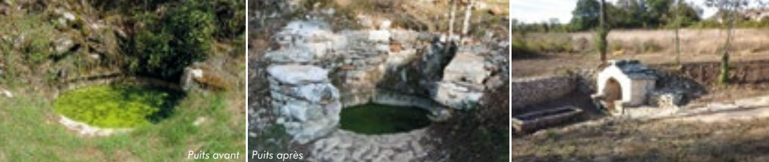
Puits avant Puits après