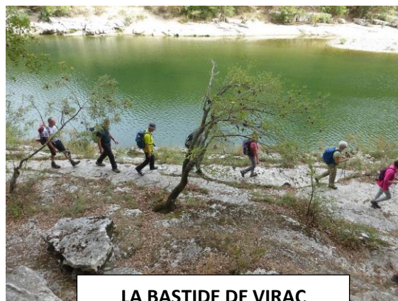
LA BASTIDE DE VIRAC