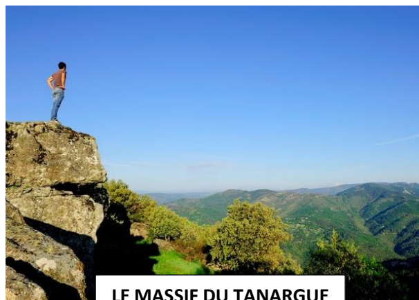
LE MASSIF DU TANARGUE