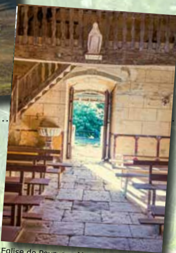
Eglise de Peyrusse-Massas