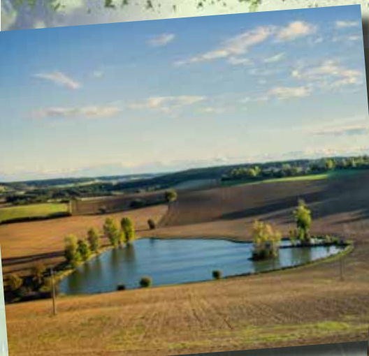
© Isabelle Souriment Vue de Peyrusse-Massas