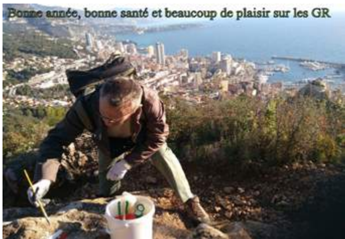
Bonne année, bonne santé et beaucoup de plaisir sur les GR

Le travail annuel de tous les baliseurs permet à tous les randonneurs de pratiquer leur passion en toute sécurité et l'esprit tranquille. Nous avons axé l'année 2016 sur une amélioration du nombre de kilomètres à baliser, mais aussi sur la qualité de notre balilage. Les GR® sont la vitrine de la FFRandomnée pour le département 06, mais aussi pour tous les randonneurs, le conseil Départemental et les communes traversées.